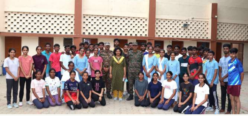
એન.સી.સી. કેડેટ્સની પસંદગી -અનુશાસન અને એકતાની દિશામાં પહેલું પગથિયું

ગૂજરાત વિદ્યાપીઠમાં નવા એન.સી.સી. કેડેટ્સના પ્રવેશ સાથે શિસ્ત, એકતા અને રાષ્ટ્રસેવાનો જુસ્સો ઝળહળી ઉઠ્યો હતો. પસંદગી પ્રવેશ સુધીની આ યાત્રા માત્ર એન.સી.સી.માં જોડાવા પૂરતું જ સીમિત ન રહેતા રાષ્ટ્રપ્રેમ, જવાબદારી અને નેતૃત્વ તરફનું મહત્વપૂર્ણ પગથિયું છે. નવોદિત કેડેટ્સ હવે શિસ્તબદ્ધ નાગરિક બની દેશની સેવા માટે સમર્પિત જીવન જીવવાની દિશામાં આગળ વધશે. ગૂજરાત વિદ્યાપીઠને ગર્વ છે કે તેની નવી પેઢી એન.સી.સી.ની પરંપરાને આગળ ધવાવી રહી છે.